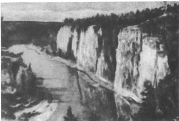
Река Чусовая. Урал