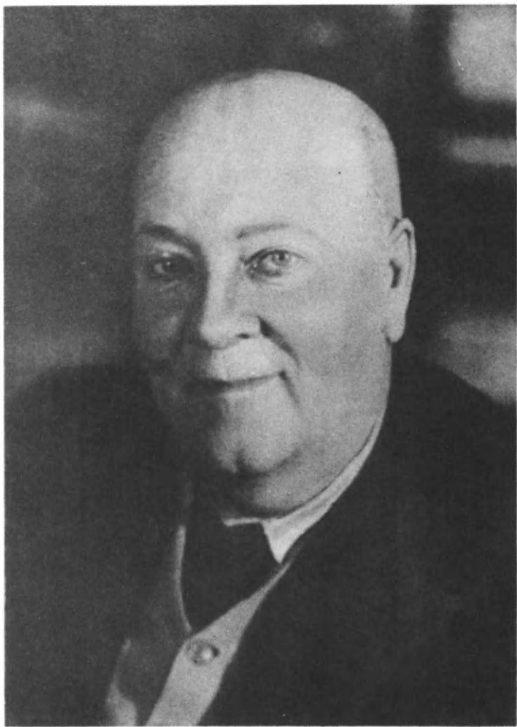
Академик А. Е. Ферсман