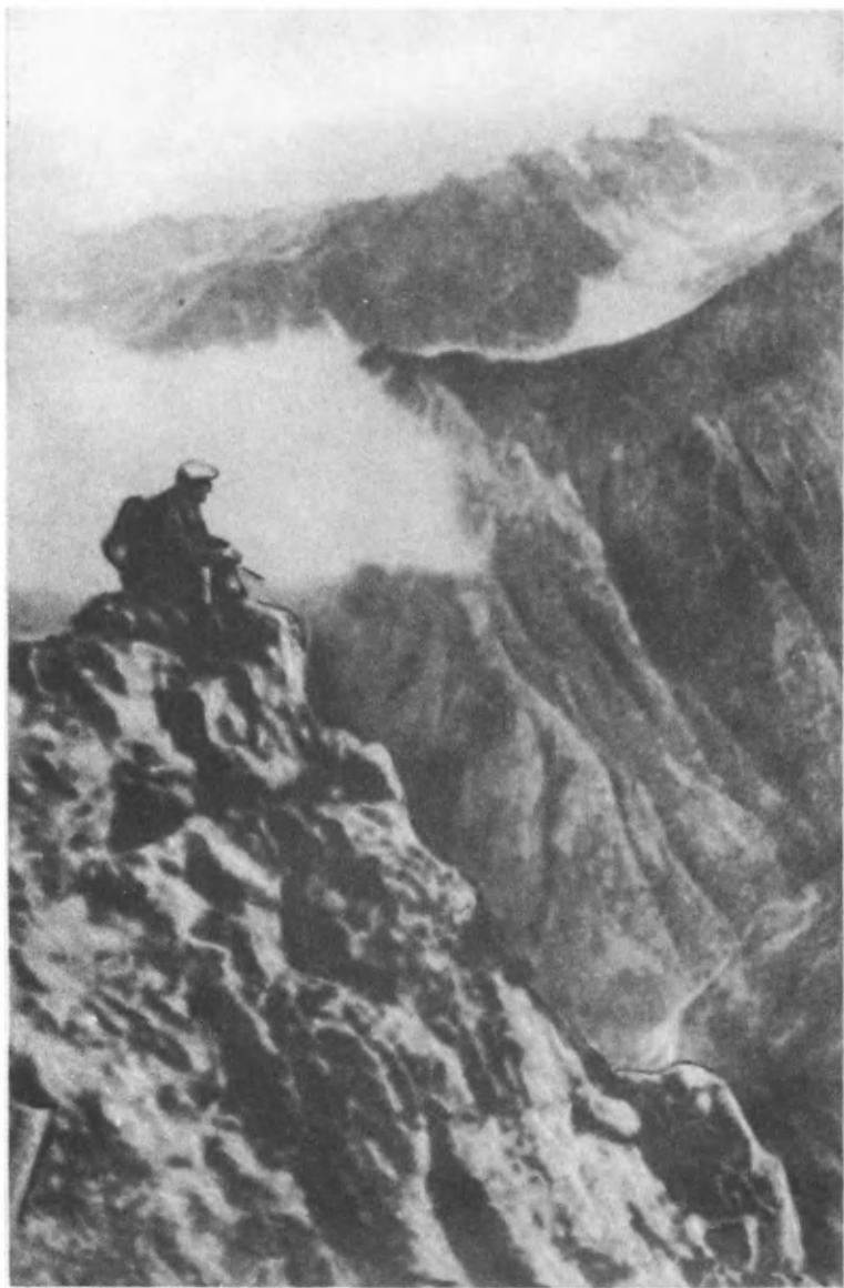
На склонах Передового хребта