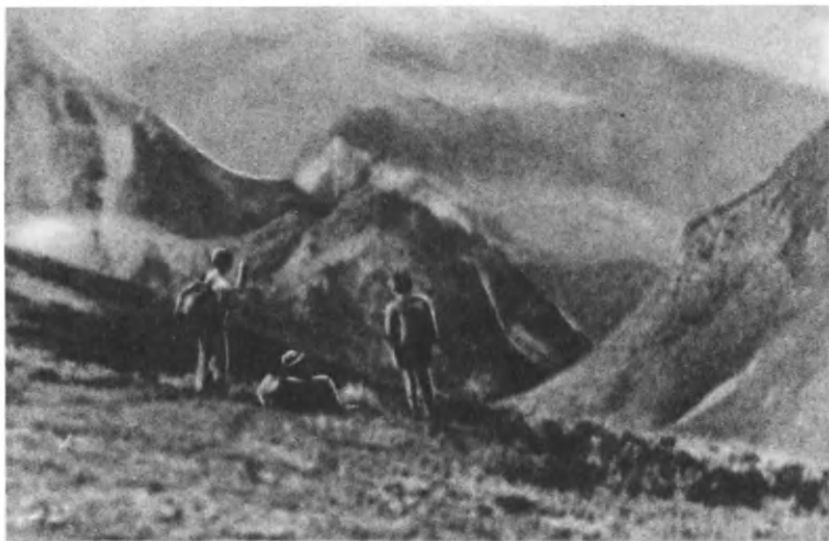
В горах Северо-Западного Кавказа