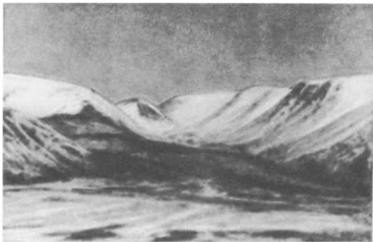
Вид с горы Вудъяврчорр. Хибины