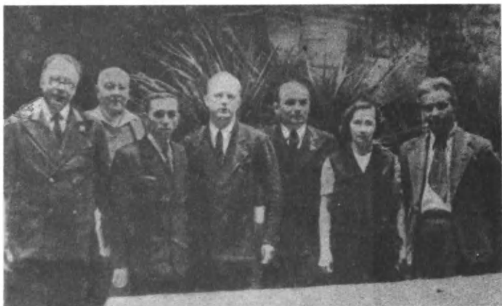
В Доме летчиков гражданского воздушного флота, 1940 г. Второй слева А. Е. Ферсман