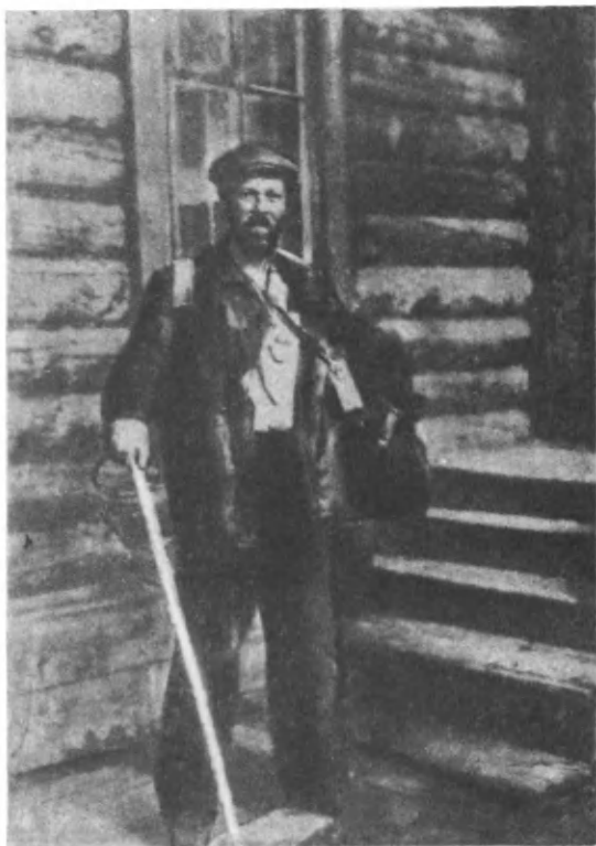
В годы Хибин- ской эпопеи