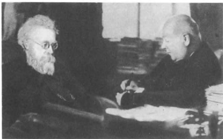
Учитель и ученик. В. И. Вернадский и А. Е. Ферсман, 1940 г.