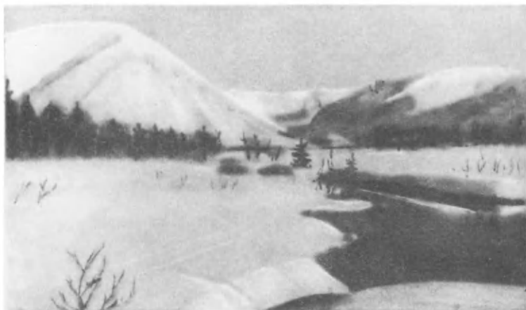
Хибины весной. Центральный район