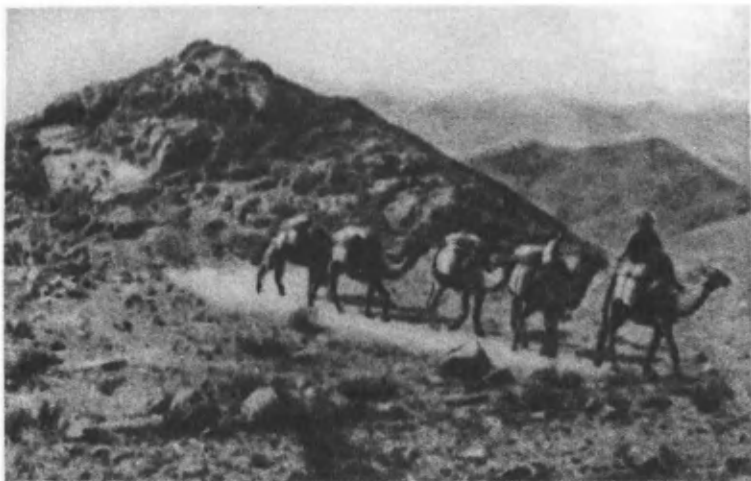
В горах Могол-тау около г. Ленинабада